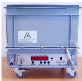
Simulateur de Fin de Traite (SFT) (© Atauce)

Vignette apposée à l'issue d'un Dépos'Traite®