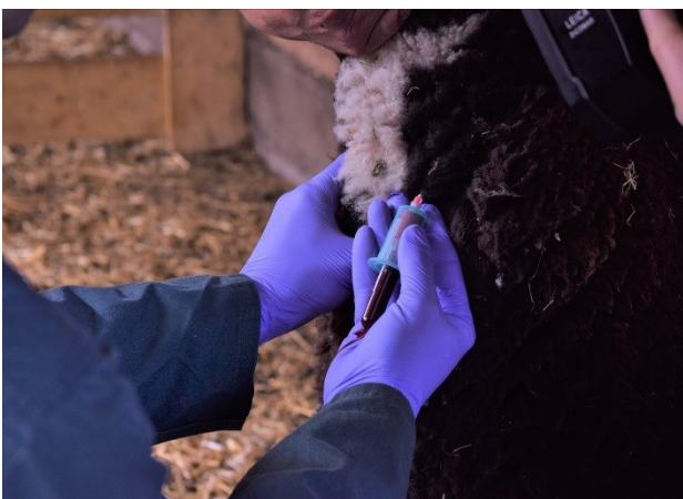
Prélèvement sanguin sur une brebis.

Le statut sanitaire peut être effectué à différentes périodes. Il est notamment utile lors de la constitution d'un troupeau et lors de mouvements d'animaux (achats, pension...) :