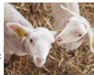
Des agneaux correctement identifiés

Tous les animaux doivent être identifiés avant l'âge de 6 mois au plus tard et avant toute sortie de l'exploitation. Il est donc primordial de s'assurer de la bonne identification des animaux lors d'un achat.