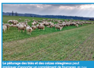
Le pâturage des blés et des colzas oléagineux peut impliquer d'apporter un complément de fourrages.